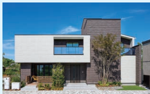
住むほどに味わいを増す、 個性あふれる外観デザインを叶えます