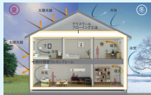
業界トップレベルの断熱性能を実現。 夏涼しく、冬暖かい