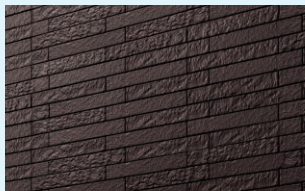
表現力豊かな表情と温もり、 耐久性に優れたハイオリティタイル